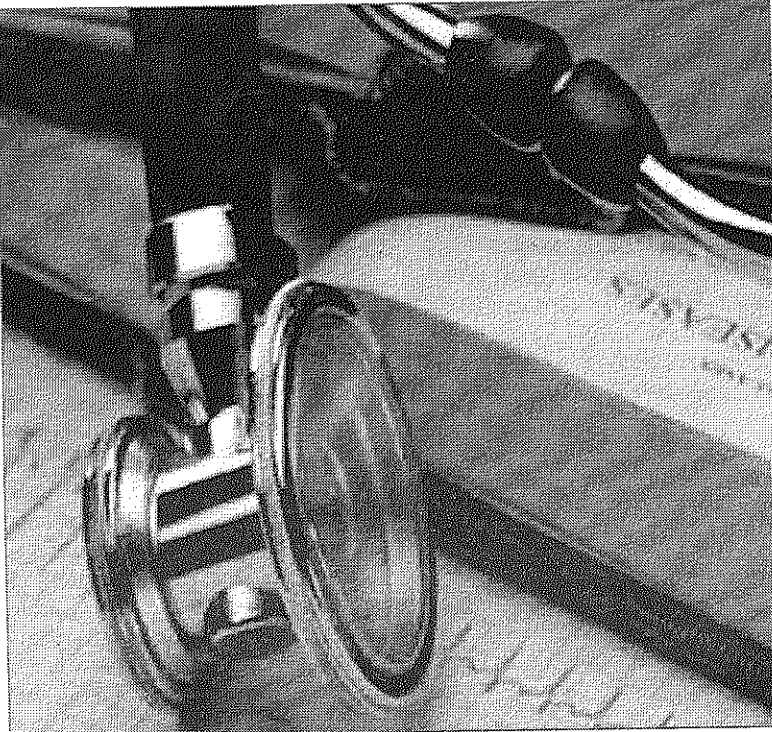
La autoridad indicó que el evento, que tendrá lugar en el Camping de la Comdes.

Se trata de los Foros de Salud "Construyamos Juntos una Mejor Salud para Todos y Todas", una iniciativa inédita que se está efectuando por primera vez en el país y en Calama, y que busca recibir insumos e información de la ciu-